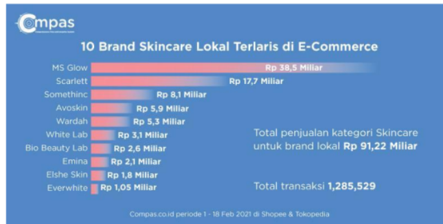
Gambar 1.2 10 Brand Skincare Lokal terlaris di e-commerce

Berbagai macam merek brand skincare mulai banyak berinovasi dari yang sudah lama maupun baru-baru muncul mengguncang dalam dunia kecantikan. Berikut merupakan data penjualan skincare lokal yang terlaris di E-Commerce sebagai berikut: