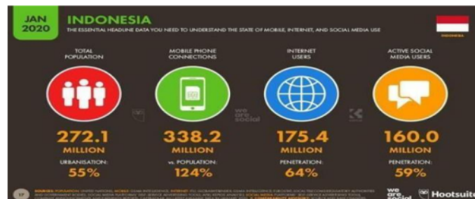
Gambar 4 Jumlah Pengguna Internet di Indonesia

Saat ini, media sosial merupakan komponen penting baik dalam penyiaran berita maupun aksesnya (Herrero, 2019). Pengenalan media sosial ke dalam bidang jurnalistik telah menghasilkan sejumlah pergeseran, salah satunya adalah peningkatan partisipasi anggota masyarakat umum atau audiens dalam proses pelaporan. Audiens di media sosial sangat mudah, dan siapa saja yang menggunakannya bebas untuk memberikan ide, kritik, suara pemikiran, bahkan menyebarkan informasi kepada orang lain yang juga menggunakan media sosial. Jika dibandingkan dengan media tradisional, media sosial ditandai dengan sifat kecepatan tinggi dalam hal pengumpulan dan penyebaran informasi. Penyebaran informasi dalam berbagai format, baik audio, visual, maupun video teks, juga menjadi kemampuan tambahan media sosial (Nasrullah 2016).