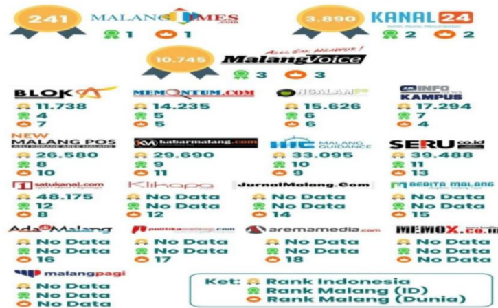
Gambar 3 Peringkat Media di Malang Raya berdasarkan Alexa