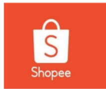
Gambar 1.1: Logo Shopee

pembayaran bulanan tanpa kartu kredit dengan menggunakan ide "beli sekarang, bayar nanti". Tersedianya fitur Paylater membuat pembelian online menjadi lebih hemat. Paylater adalah sistem pembayaran yang mudah digunakan karena persyaratannya yang sedikit, proses pendaftaran yang mudah, dan proses aktivasi akun yang mudah. Untuk mencari pembayaran cicilan, perusahaan E-Commerce di Indonesia kini dapat memanfaatkan layanan Paylater. Di antaranya adalah aplikasi Shopee.