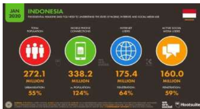
Gambar 1 Pengguna internet di Indonesia tahun 2020

internet dan media sosial untuk memenuhi setiap aktivitas dan kebutuhan pokok, termasuk sandang dan pangan. Media sosial membuat orang puas dengan fasilitas yang melibatkan berbagai konten. Salah satunya adalah media sosial seperti institusi, yang merupakan media komunikasi digital yang cukup mudah diakses. Melalui media sosial Instagram, pengguna dapat mempublikasikan berbagai produk pemasaran media secara online (Aprilya dalam Hildayanti et al, 2020: 69-79).