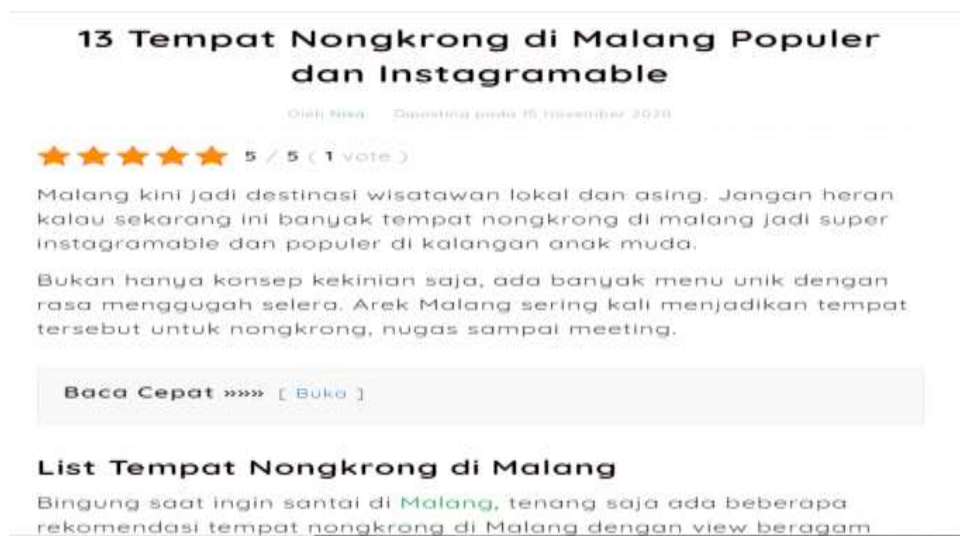
Gambar 2 13 Café di Malang Yang Populer dan Instagramable (Sumber : Screenshoot google, di posting pada 15 November 2020)

No.25, Mojolangu, Kec. Lowokwaru, Kota Malang, Jawa Timur 65142. Sebuah kafe yang memberikan kenyamanan dan ketenangan, serta pengunjung tidak akan berisik meski dengan anak-anak. Cafe live music di Malang ini sangat ramai pada malam hari, biasanya dengan musik jazz. Madame Wang Secret Garden yang beralamat di Jl. Telomoyo No.12, Gading Kasri, Kec. Klojen, Kota Malang, Jawa Timur 65115. Restoran vegetarian di Malang ini memiliki konsep modern bahkan menjadi cafe instagramable yang direkomendasikan. Setiap sudut kafe bisa menjadi lapangan fotografi yang unik dan menarik.